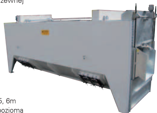
SPRÜWA 35, 6m z wylewką poziomą