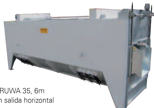
SPRUWA 35, 6m con salida horizontal